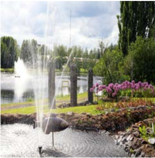
ITE-TAIDE, JUHLAPUISTO, PAPPILANSALMI