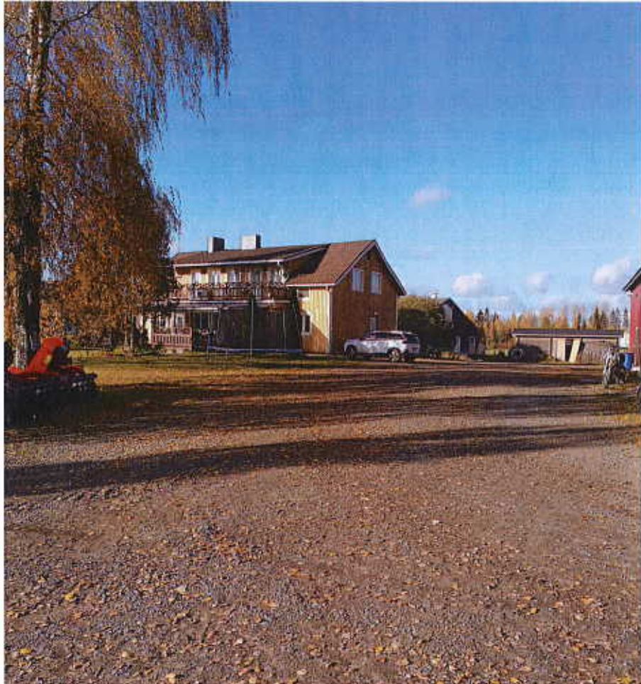
Mäntymäki- tilan asuinrakennus

Kaavoitettavalla alueella on nykyisin tilan talouskeskus, jossa on asuinrakennus, navettarakennus, talousrakennuksia ja muita maataloutta palvelevia rakennelmia. Muutoin alue on pääosin pelto-alueita.